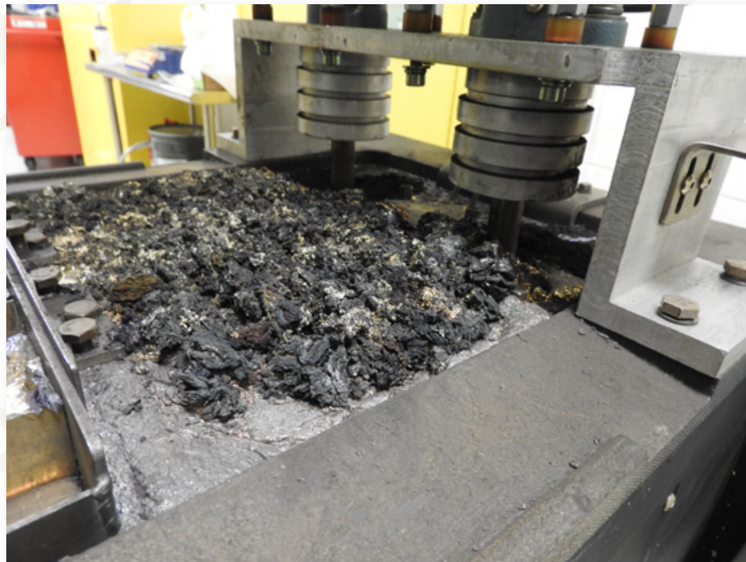
CRISOL DE SOLDADURA CON 2.5CM (1") DE ESCORIA